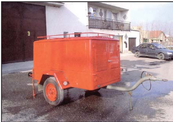
Stříkačka PPS 12