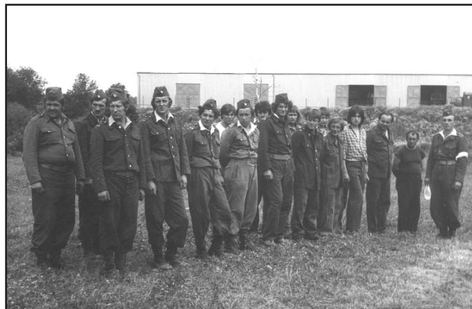
Z okrskových soutěží v 80. letech