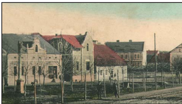
Pohled na střed Žihle z počátku 20. století

Dále se uvádí, že se Žihle za husitských válek dostala do světského držení, konkrétně v roce 1422 Beneši z Rabštejna, ale okolnosti návratu plaskému klášteři jsou prozatím nejasné. A tak další již konkrétní údaj se vztahuje až k roku 1448, kdy plaský klášter zastavuje Žihli Janu Caltovi z Kamenné Hory, který vlastnil tehdy Rabštejn. Od