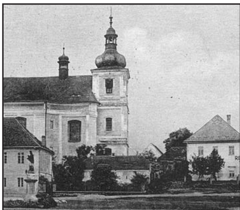
Původní hasičská zbrojnice u kostela