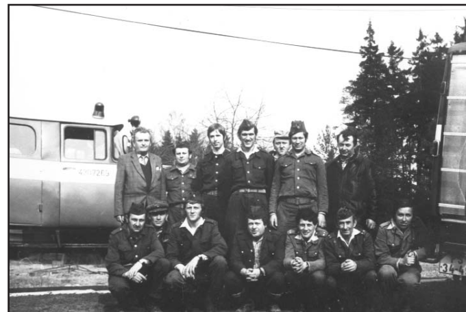
Jednotka SDH Žihle na námětovém cvičení na Sklárně