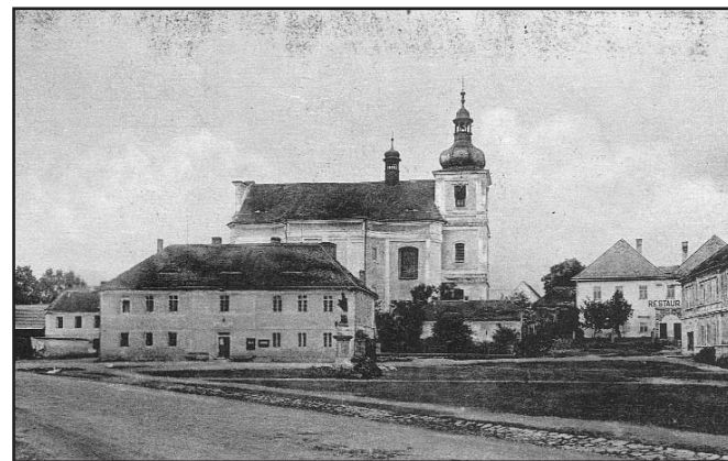
Pohled na náměstí asi z roku 1925

V době svého vzniku patřil žihelský hasičský sbor pod region Podbořanska a byl organizován v župě žlutickopodbořanské, která byla mj. zastoupena na ustavujícím zasedání Ústřední zemské hasičské jednoty v roce 1879. Žihle tak, i když zprostředkovaně, byla jedinou hasičskou obcí regionu severního Plzeňska, která stála u zřízení celostátní hasičské organizace. Tehdy šlo o tzv. jednotu německou, do níž