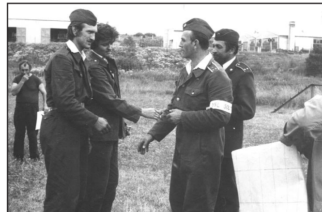
Z okrskových soutěží v 80. letech

Výsledek 2. světové války znamenal pro Žihli poměrně výrazný historický zlom. Již v květnu 1945 se do obce vrací obyvatelé, kteří ji byli nuceni opustit v roce 1938 a od června