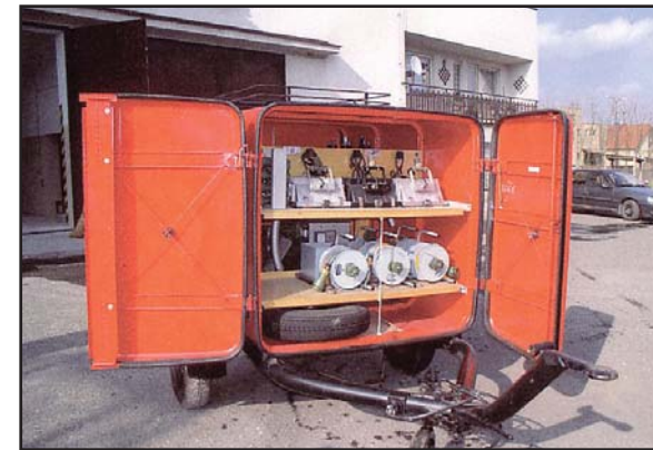
Osvětlovací agregát BLA 4