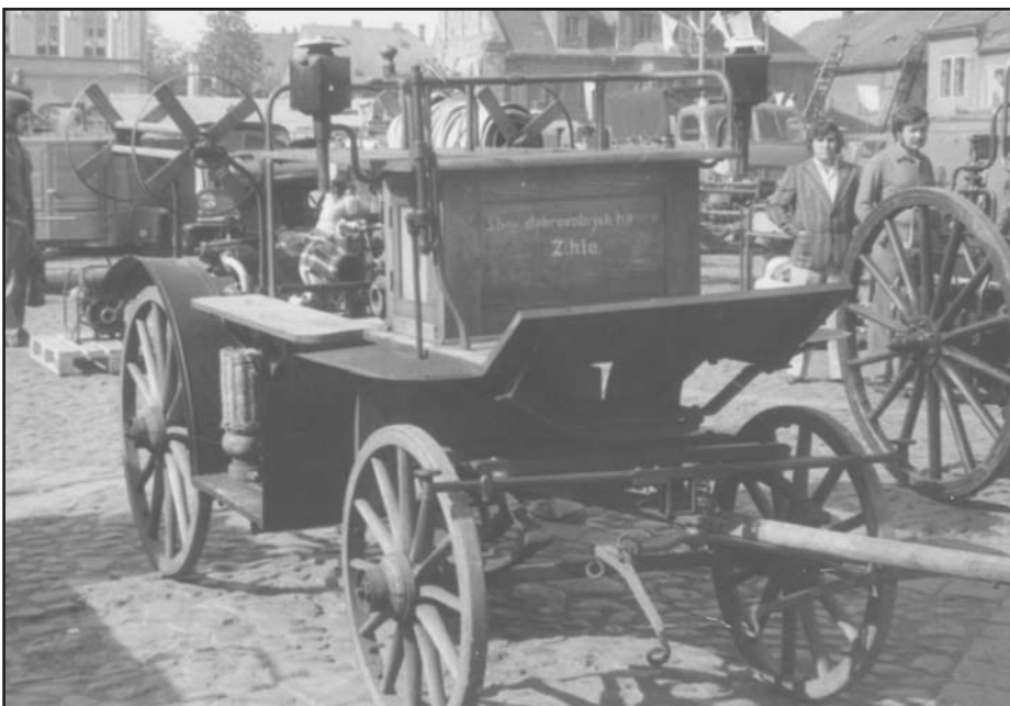
Kočárová hasičská stříkačka FLADER z roku 1927