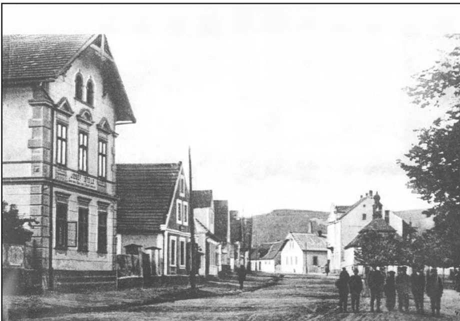
Střed obce Žihle v polovině 20. století