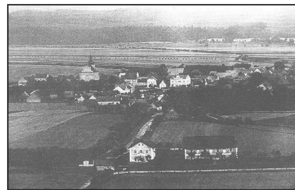
Pohled na obec Žihle z roku 1920

V roce 1873 byla do Žihle zavedena železniční trať a byly tak vytvořeny dobré před-