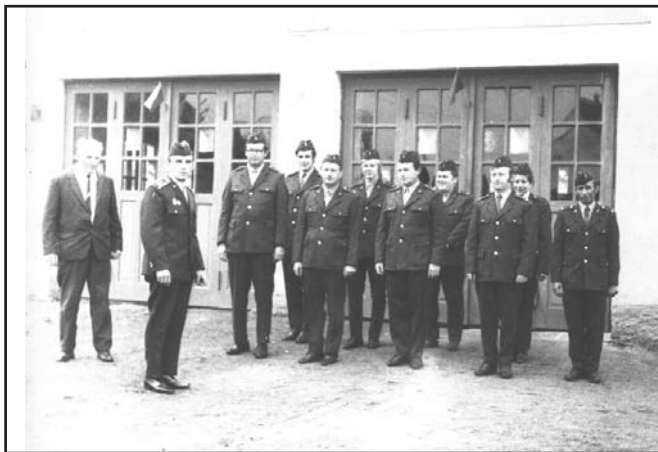
Členové SDH před hasičskou zbrojnicí

Poměrně významnou se pro práci jednotlivých sborů stala konference požárníků Plzeň - sever v roce 1979, která byla v mnohých ohledech kritická a vyžadovala u řady sborů