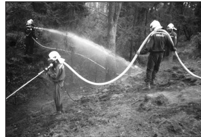
Likvidace lesního požáru u Přehořova

Sbor dobrovolných hasičů v Žihli byl a je zařazen podle zákona 239/2000 Sb. do Integrovaného záchranného systému, a to ve 2. stupni. První stupeň tvoří profesionální