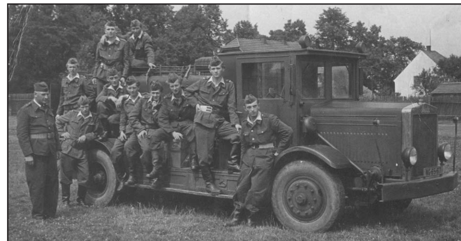
Členové hasičského sboru s automobilem Škoda 506 na okresní soutěži v Žihli v roce 1959

V rámci okresů byly sbory ještě rozčleněny do menších celků tzv. okrsků, jejichž centrem byla vždy největší obec, zpravidla také s největším a nejlépe vybaveným sborem. Velikost okrsku se měnila v závislosti na různých podmínkách, jednak na vlastní existenci sborů, ale změny přinášely i administrativní zásahy. Žihelský okrsek zahrnoval Hlubokou, Tis u Blatna, Velečín, Pastuchovice, Přehořov a Potvorov, který byl později přiřazen k okrsku Bílov.