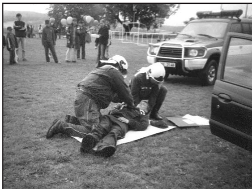
Ukázka zásahu na Dětském dni v roce 2004

Výroční valná hromada, na kterou byly pozvány i manželky členů, konstatovala, že aktivita členů začíná stoupat a uložila si na rok 2002 náročnější úkoly. Během něho se podařilo uspořádat Okrskovou soutěž požárních družstev v Žihli za účasti sborů z Tisu, Pastuchovic a Přehořova. Výroční valná hromada ocenila aktivní přístup především nových členů sboru a udělila jim Čestná uznání základní organizace za jejich práci při zajištění náročných úkolů v roce 2002.