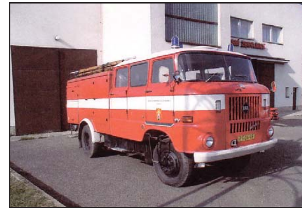
IFA AS 16