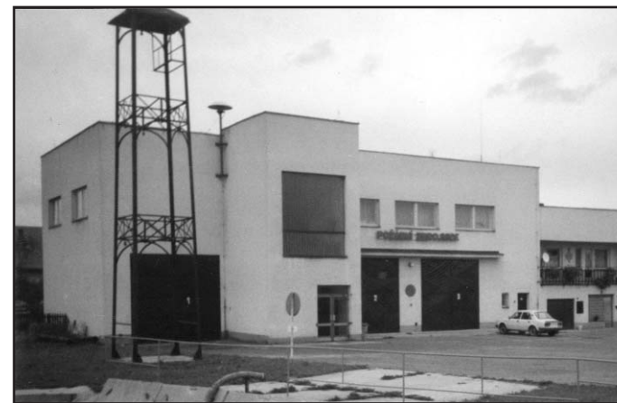
Hasičská zbrojnice postavená v letech 1986 -1988

Významnou událostí roku 1988 bylo otevření nové požární zbrojnice, která byla vystavěna v letech 1986 - 1988 v tzv. akci "Z" (Zvelebení za pracovní účasti občanů bez nároku na finanční odměnu) v místech pod pilou v jihozápadní části obce, v těsném