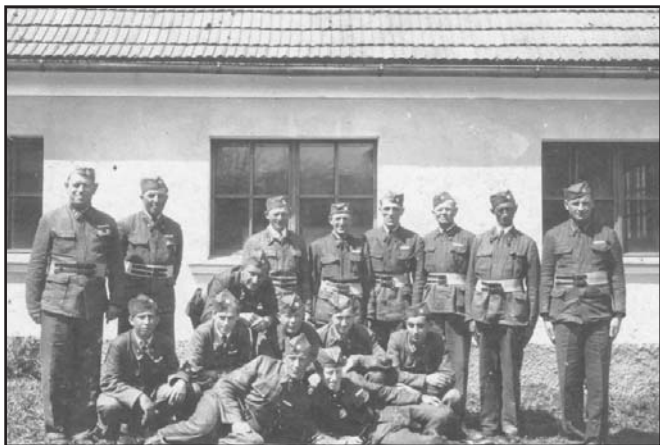
Pováleční členové SDH před hasičskou zbrojnicí