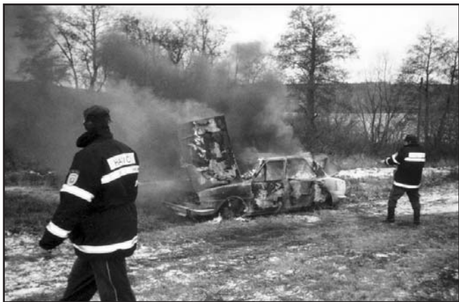
Nácvik likvidace požáru osobního automobilu v roce 2003

Od roku 1970 se začínají pravidelně konat tzv. námětová cvičení v objektech veřejného zájmu, podnicích a zemědělských zařízeních. Úkolem těchto cvičení bylo prověřování