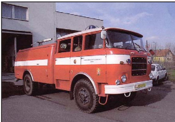
Cisterna CAS 25 LIAZ