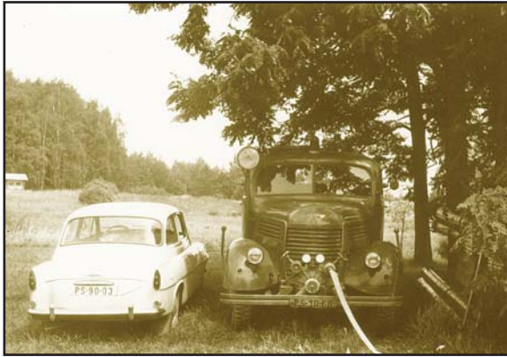
Pohled do historie hasičské techniky