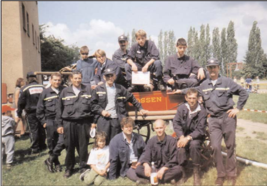
Družstvo dobrovolných hasičů na soutěži v Jesenice v roce 2003