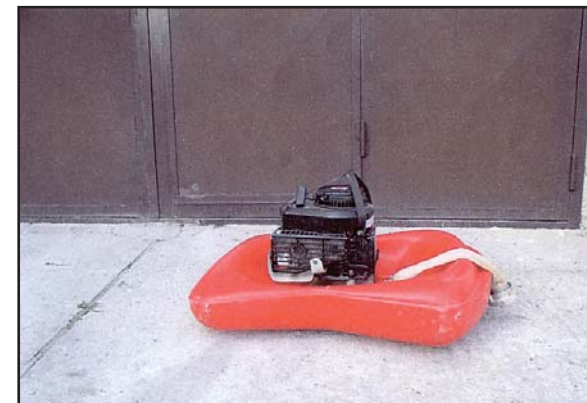
Plovoucí čerpadlo FROGI