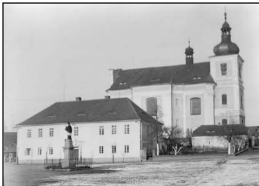
Kostel sv. Václava

Na místě dnešního hřbitovního kostela měla dříve stát menší kaple vzniklá v roce 1667, kdy ji nechali postavit dva bratři, místní měšťané z čp. 14. Z blíže zatím neurčených důvodů byl na místě této kaple v roce 1777 postaven kostel sv. Filipa a Jakuba, který se později stal kostelem hřbitovním.